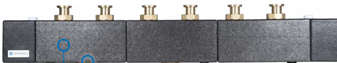
PROFUSION HSM 90-3