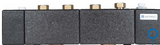
PROFUSION HSM 125-2

Idealnie dopasowana do każdego modułu, estetyczna izolacja termiczna zapobiega stratom ciepła